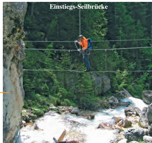
Steig durch die Silberkarklamm