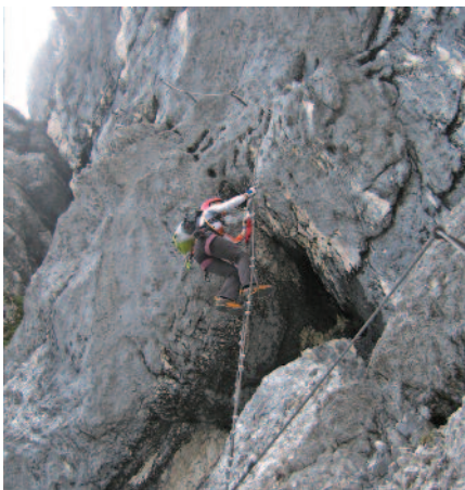
Die Drahtseilleiter im Mittelteil