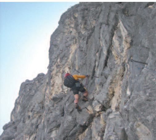
Nach der 2. Rampe (D/E und D)

Oder auch über den Wanderweg östlich bergab zum Wanderweg KE5 und über diesen querend und ansteigend nordwestlich zur Bergstation der Kreuzeckbahn (einfachster Abstieg, aber viel länger; ca. 2 Std.).