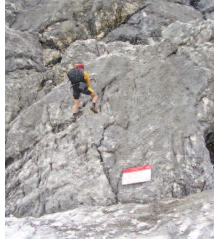
D-Stelle beim Einstieg